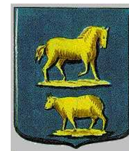
Wapen van Deil